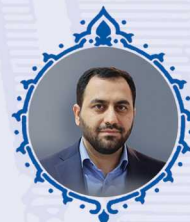
محمد ترکمانه عضو هیئت نمایندگان