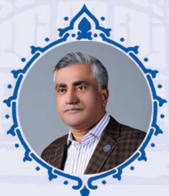
بدر دریان عضو هیئت نمایندگان