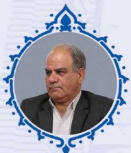
محسن عسکری عضو هیئت نمایندگان