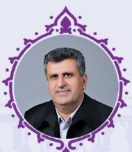
محمد آشینه نائب رئیس دوم