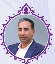
حسن روحانی تازیانی نائب رئیس اول