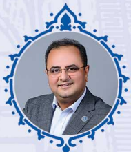
سید محسن بنی هاشمی عضو هیئت نمایندگان