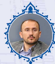
اسحاق بندانی عضو هیئت نمایندگان