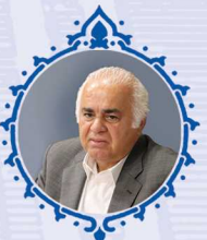
مهرداد بازرگان عضو هیئت نمایندگان