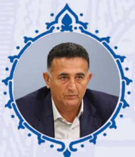
وحید تهمتن عضو هیئت نمایندگان