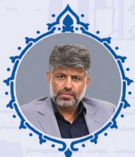
عارف بستگانی عضو هیئت نمایندگان